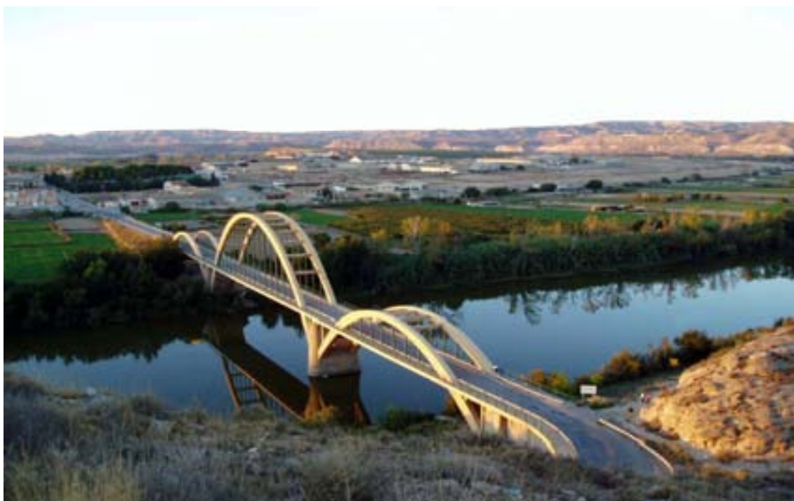
Pont sobre l'Ebre des del "mirador". SÁSTAGO

“Herru Sánctiagu, Got Sanctiagu. Eh, ultreia eh, sus, eia. Deus, aia, nos!...”