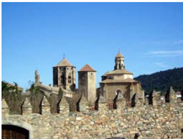
MONESTIR DE POBLET

“Herru Sánctiagu, Got Sanctiagu. Eh, Ultraia, eh, sus, eia, Deus aia nos ...”