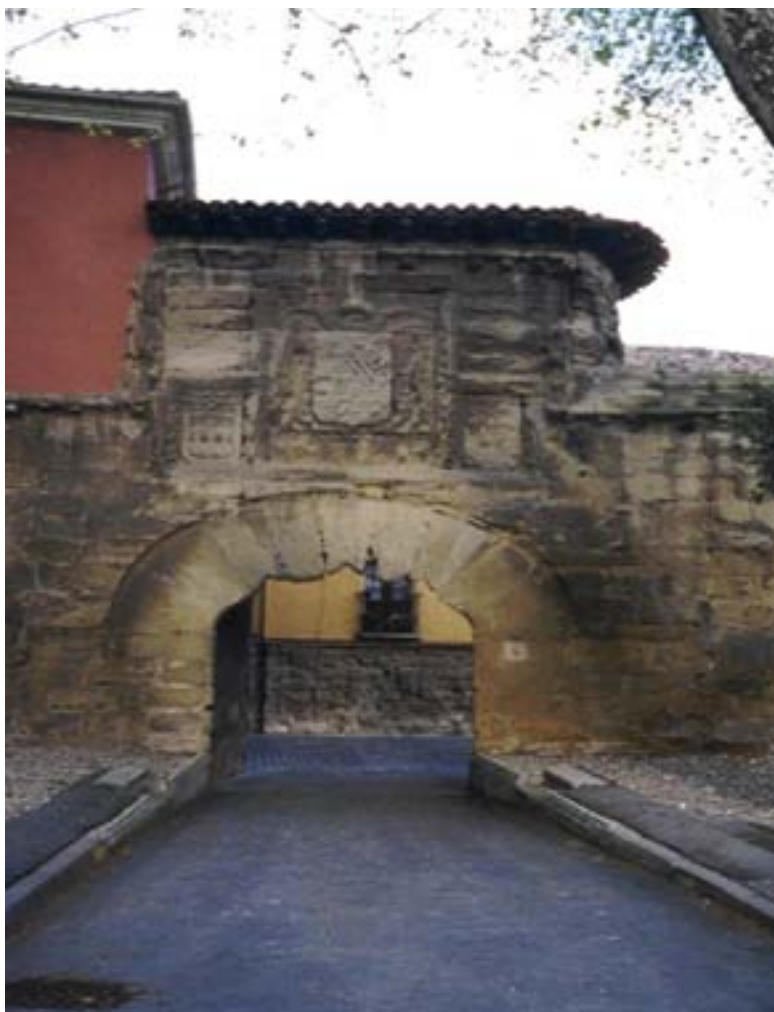
PUERTA DE REVELLÍN

“Herru Sánctiagu, Got Sanctiagu. Eh, Ultraia, eh, sus, eia, Deus aia nos ...”