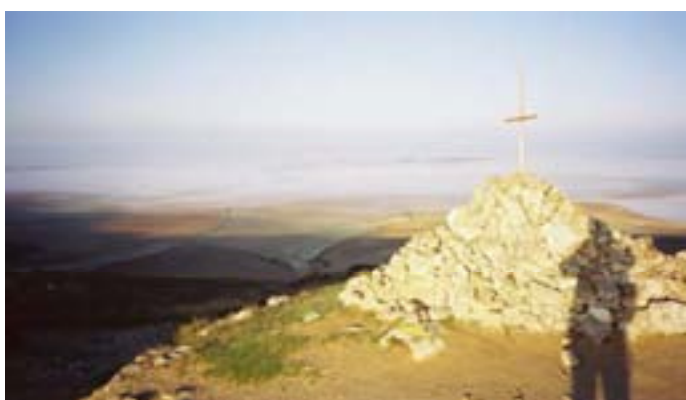
...i aquesta a l'Alto de Mostelares el setembre de l'any 1.999