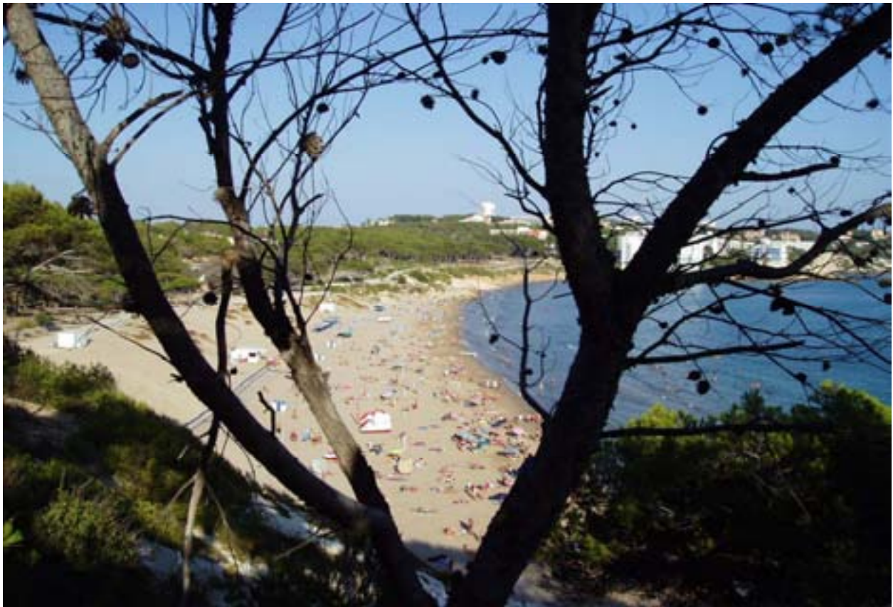
SALOU/ L'ALTAR/ PLATJA LLARGA

“Herru Sánctiagu, Got Sanctiagu. Eh, ultreia, Eh, sus, eia, Deus aia nos ...”