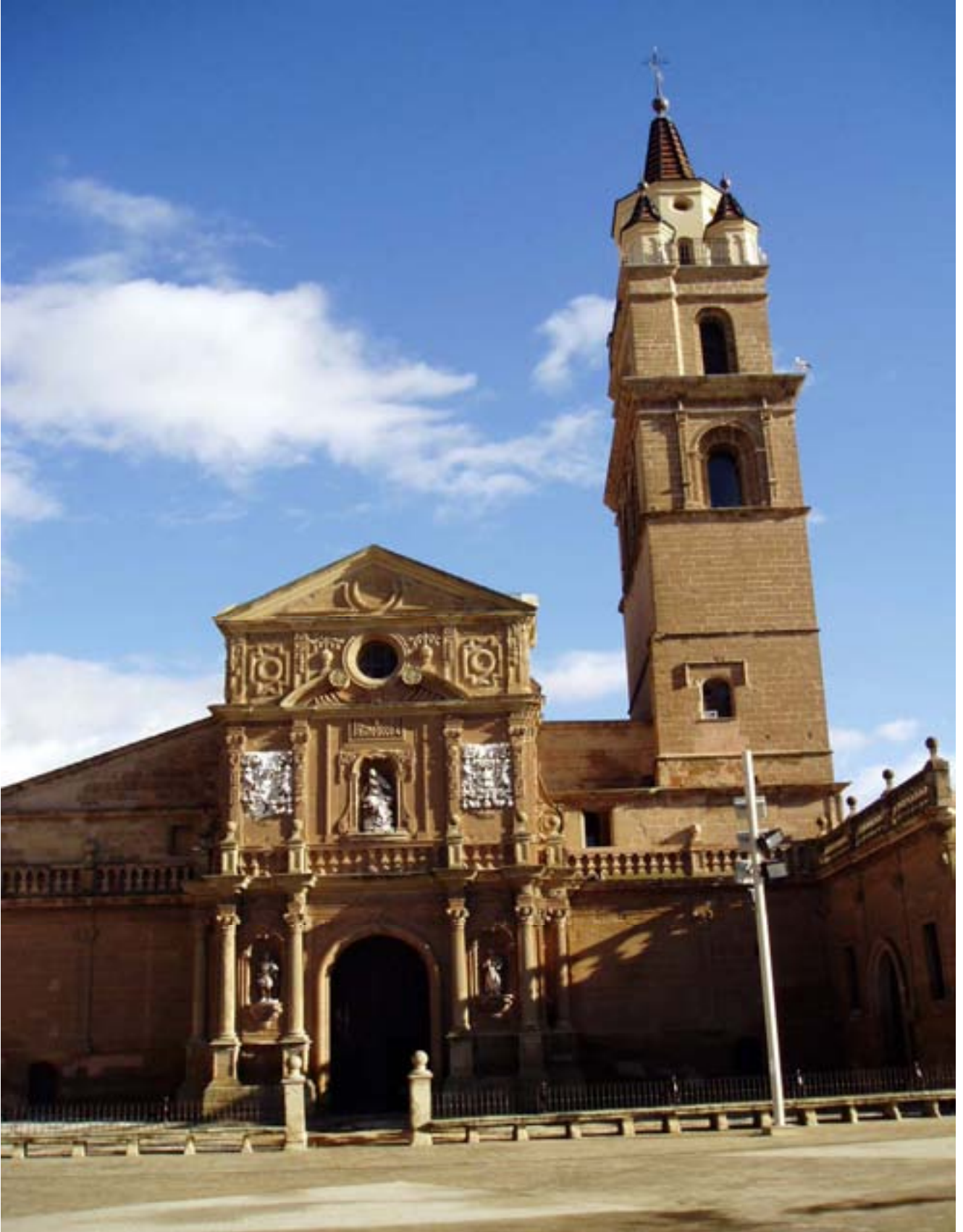
Catedral de Calahorra

“Herru Sánctiagu, Got Sanctiagu. Eh, Ultreia, eh, sus, eia, Deus aia nos ...”