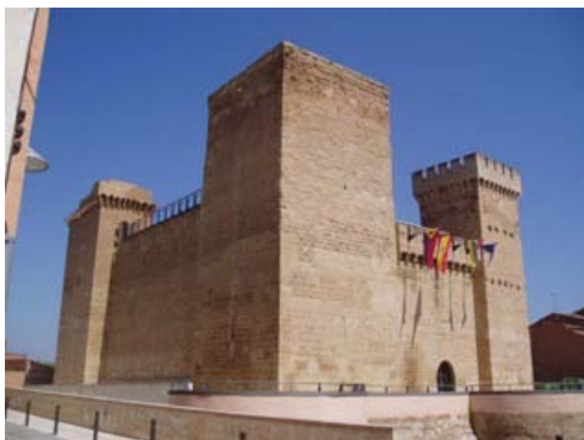
Castillo de Aguas Mansas S. XIV. AGONCILLO