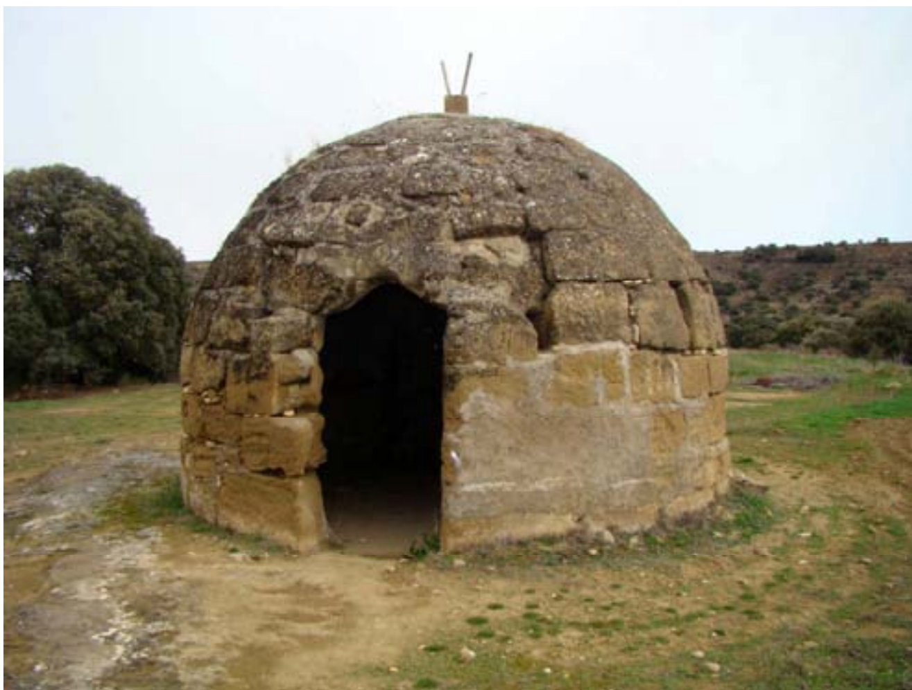
Cabana de pedra a la vora de TIERZ

“Herru Sánctiagu, Got Sanctiagu. Eh, Ultreia, eh, sus, eia, Deus aia nos ...”