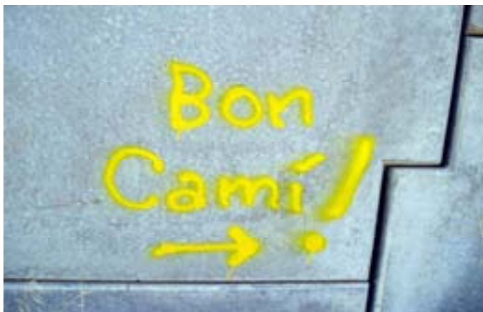
BON CAMÍ a tothom, prop de Logroño.

“Herru Sánctiagu, Got Sanctiagu. Eh, Ultreia, eh, sus, eia, Deus aia nos ...”