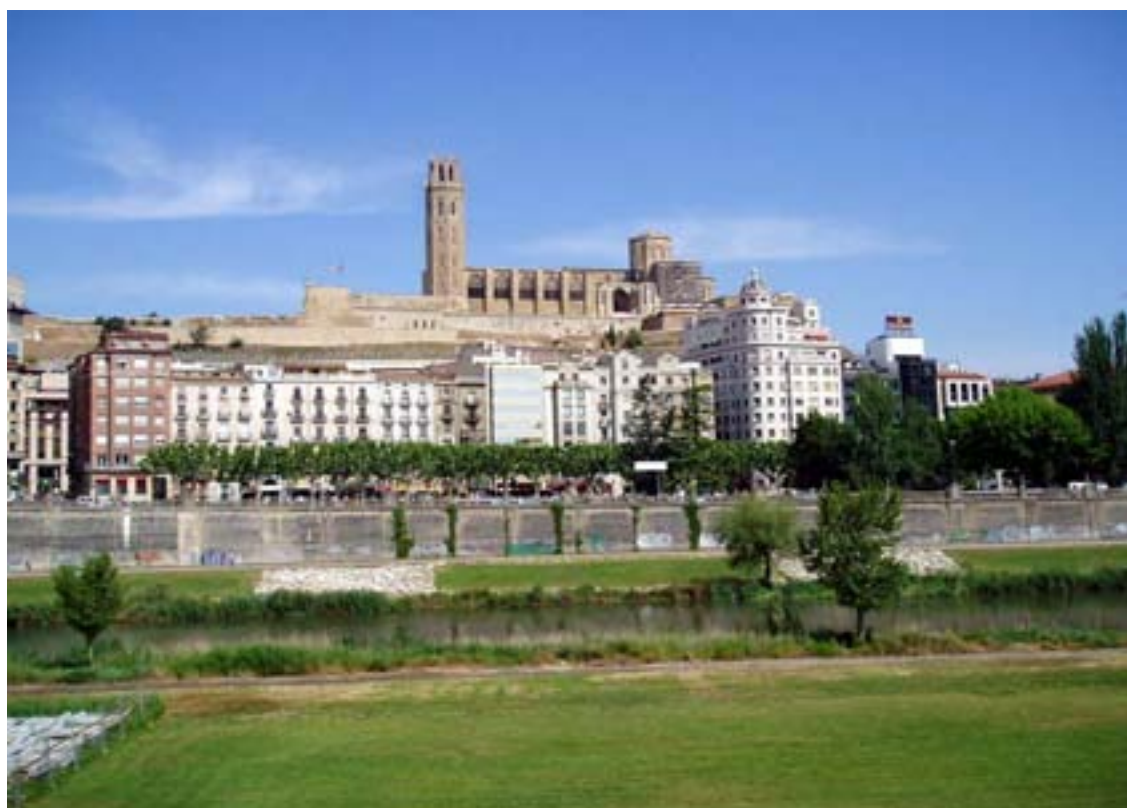
LLEIDA (vora del Segre)