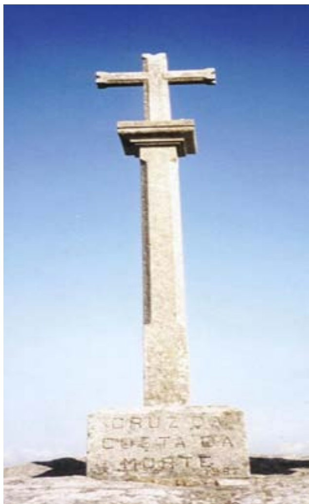
CRUZ DA COSTA DA MORTE-FISTERRA

“Herru Sánctiagu, Got Sanctiagu. Eh, Ultraia, eh, sus, eia, Deus aia nos ...”