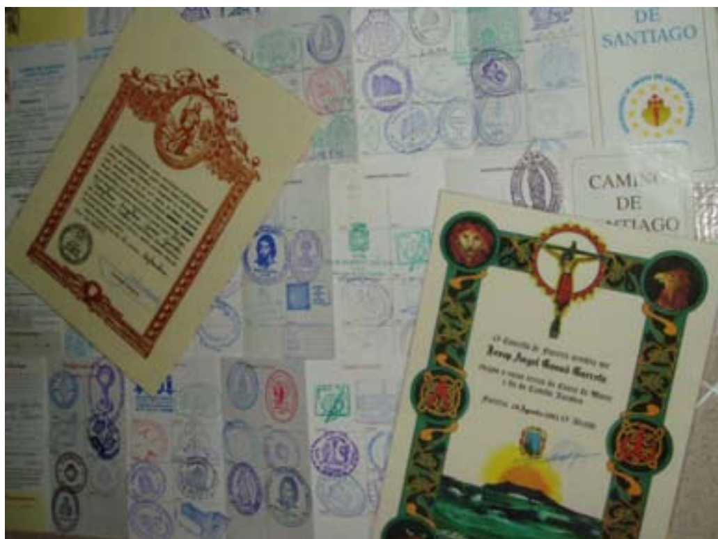
DIVERSES CREDENCIALS, COMPOSTELA I FISTERRANA