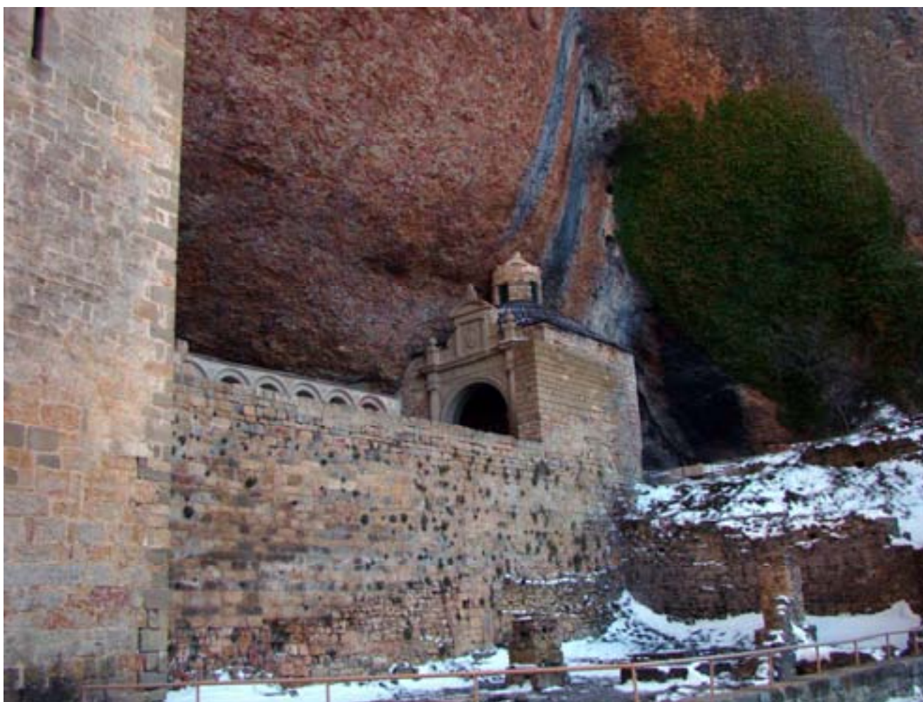
SAN JUAN DE LA PEÑA sota la balma.

Deixem el GR 1 i agafem el GR 95. El GR 1 continua cap a LINÁS DE MARCUELLO, RIGLOS, MURILLO DE GÁLLEGO, AGÜERO, etc