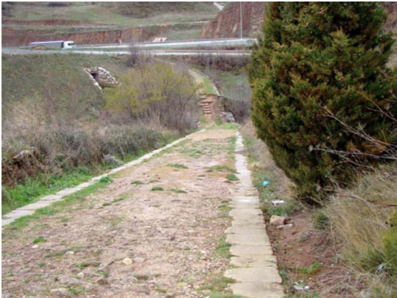
Calçada romana passat Cirauqui

“Herru Sánctiagu, Got Sanctiagu. Eh, Ultreia, eh, sus, eia, Deus aia nos ...”