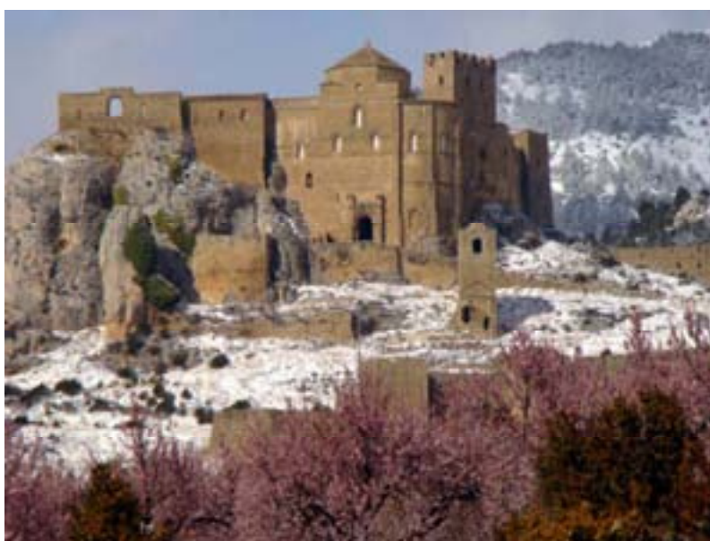
CASTELL DE LOARRE