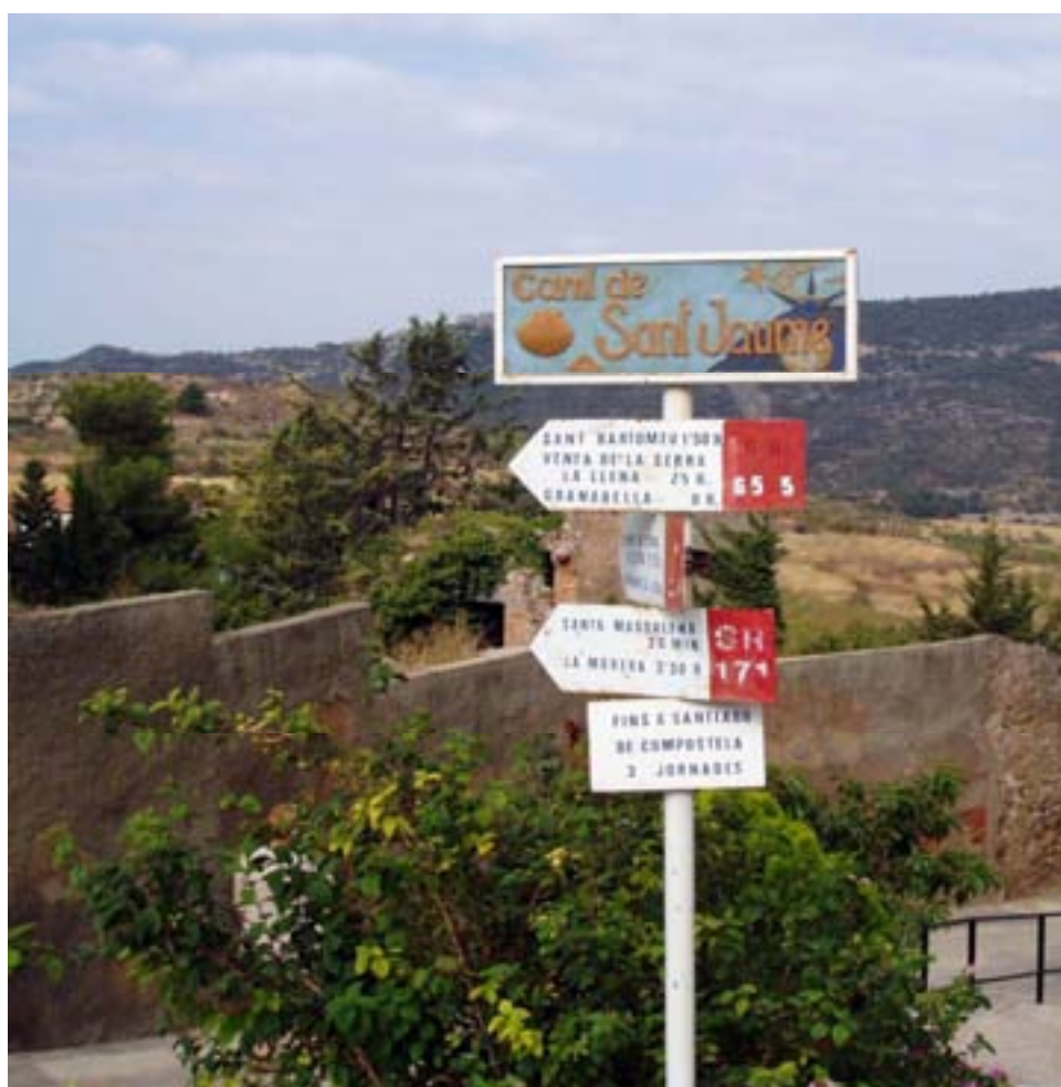
PAL INDICADOR A ULLDEMOLINS