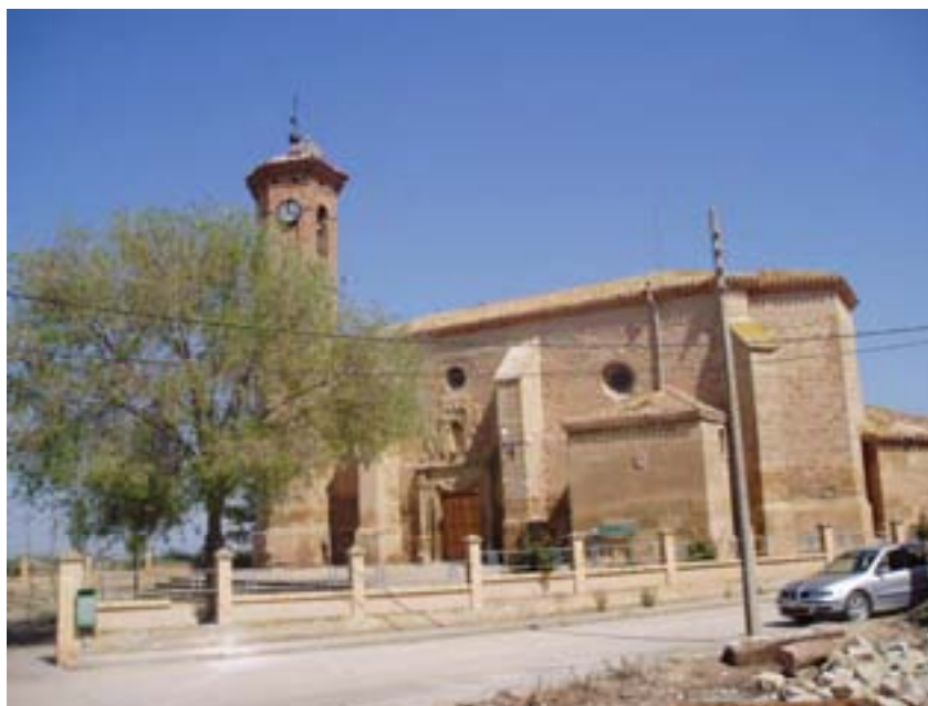
Església de Sant Salvador. ARRUBAL

“Herru Sánctiagu, Got Sanctiagu. Eh, Ultraia, eh, sus, eia, Deus aia nos ...”