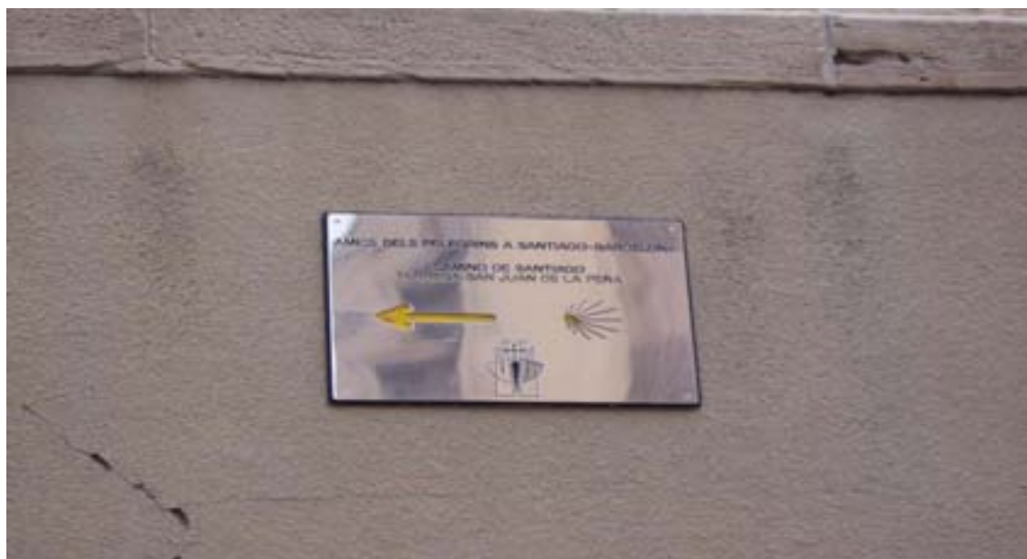
Placa a l'estació de ferrocarril de Tàrrega

“Herru Sánctiagu, Got Sanctiagu. Eh, Ultraia, eh, sus, eia, Deus aia nos ...”