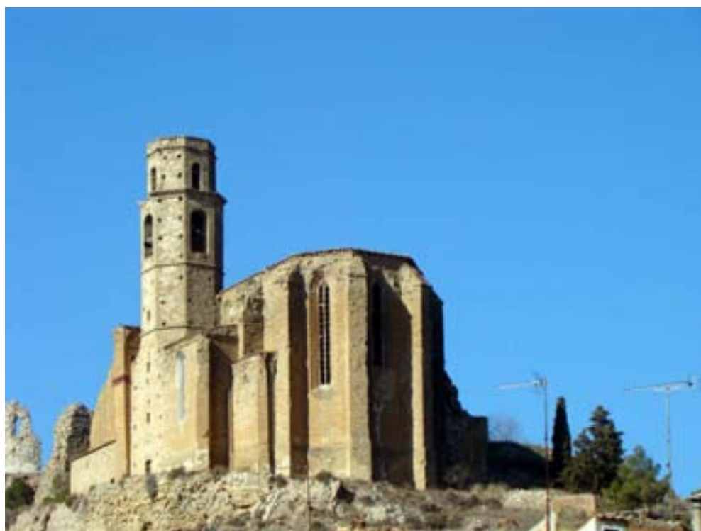
CASTELLÓ DE FARFANYA