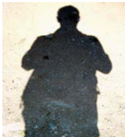
fotografia de l'autor a la vora de O'Cebreiro (novembre de 2007)...