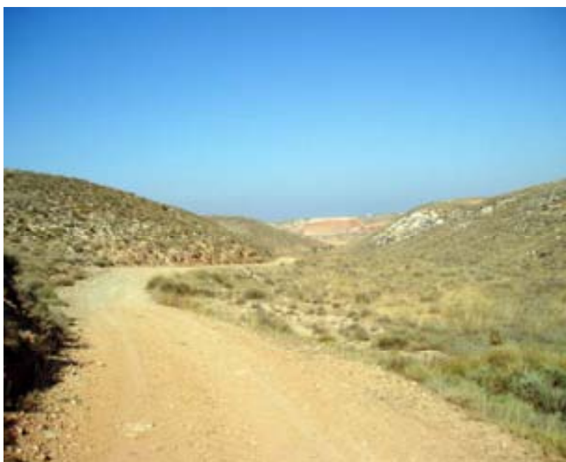
Vista del camí per la zona de Velilla de Ebro