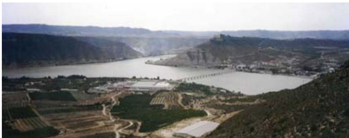
MEQUINENSA. Aiguabarreig de l'Ebre i el Segre. Pont de l'Arbora (1.999)

“Herru Sánctiagu, Got Sanctiagu. Eh, Ultraia, eh, sus, eia, Deus aia nos ...”