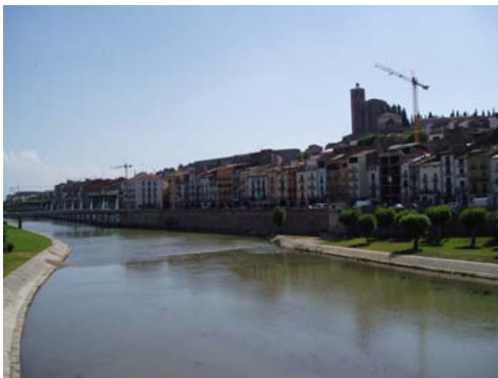
BALAGUER i el riu Segre