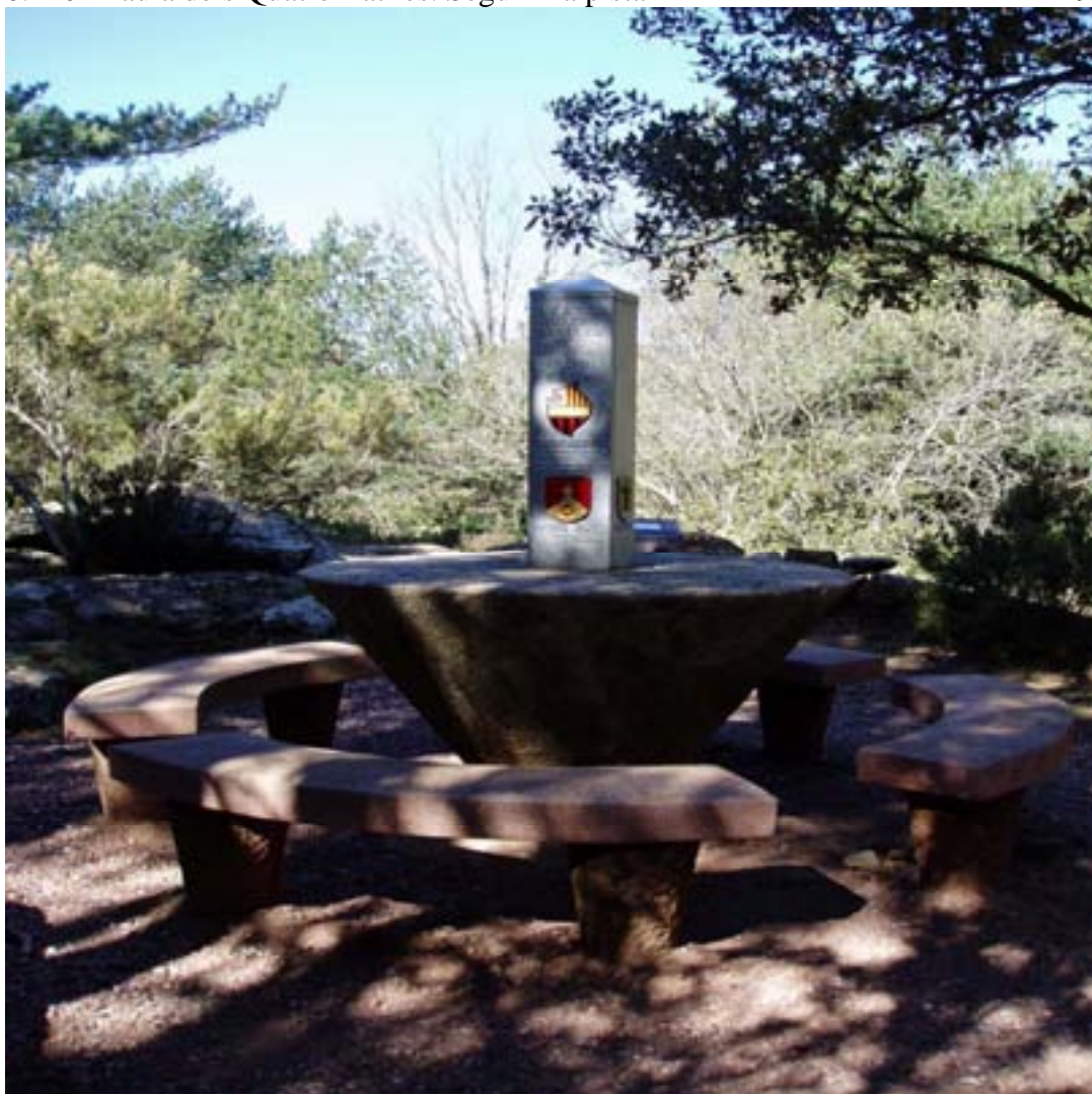
TAULA DELS QUATRE BATLLES