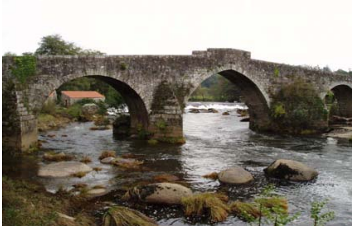
A PONTE MACEIRA

“Herru Sánctiagu, Got Sanctiagu. Eh, Ulteira, eh, sus, eia, Deus aia nos ...”